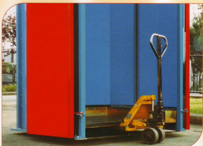
MANOVRABILITÀ Semplice nello spostamento, con muletto o transpallet con o senza balloni all'interno. HANDLING Can be easily moved with a forklift or a trans-pallet with or without bale at its inside.