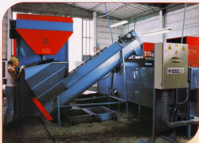
L'elevata altezza di scarico consente il collegamento diretto con altre macchine senza bisogno di un nastro elevatore. The elevated height of discharging allows to connect the Vertical Big-Bale directly to other machines without any need to add a lifting belt.