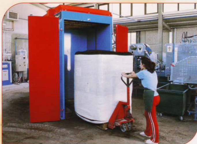
Facile il carico del ballone con qualsiasi mezzo. Possibilità di usare solo una parte del ballone, scaricarlo e utilizzarlo successivamente perché rimane integro. Easy to load the bale with any kind of means. Possibility to use only one part of the bale, unload it and use it afterwards because it remains undamaged.