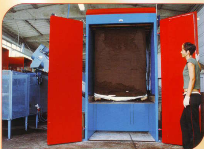
Elevatore senza riduzioni per pallet. Elevator without reductions for pallet.