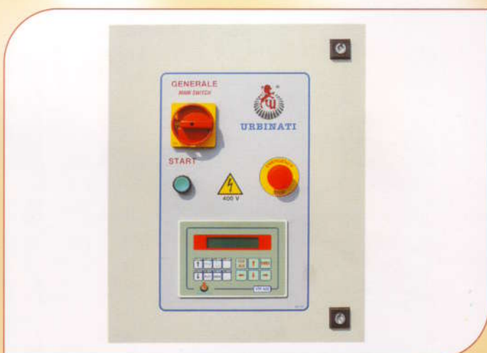
PROGRAMMAZIONE - Quadro di controllo. La macchina è completamente gestita da un PLC con visualizzazione delle funzioni su display. PROGRAMMING - Control panel. The machine is completely controlled by a PLC and the functions are shown on display.