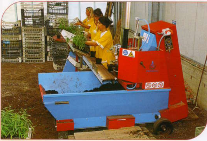
IA 2400 in fase di lavoro con ripicchettaggio manuale. IA 2400 potting machine working by manual transplanting.